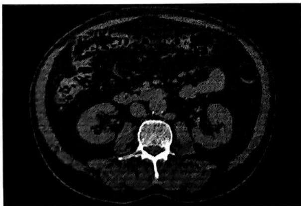
Рис. 1. Выделение скелетных мышц на компьютерной томограмме, уровень позвонка LIII

Имеются также данные об оценке массы паравerteбральных мышц как на протяжении всего поясничного отдела позвоночника, так и на уровне отдельных межпозвонковых дисков [19, 20]. Наибольшее распространение в количественной оценке мышечной ткани получил подход с определением площади всех поперечнополосатых мышц, входящих в зону сканирования на уровне LIII позвонка ( m. psoas major , m. erector spinae , m. quadratus lumborum , m. obliquus externus abdominis , m. obliquus internus abdominis , m. transversus abdominis , m. rectus abdominis ). Для этого на КТ-изображении, полученном на уровне каудального края тела LIII, вручную выделяется область и определяется площадь ( \text{см}^2 ) мышечной ткани (рис. 1). Используемый диапазон ослабления рентгеновского излучения для скелетных мышц — от +150 до -29 НУ, что позволяет нивелировать попадание в зону интереса костной ткани, паренхиматоз-